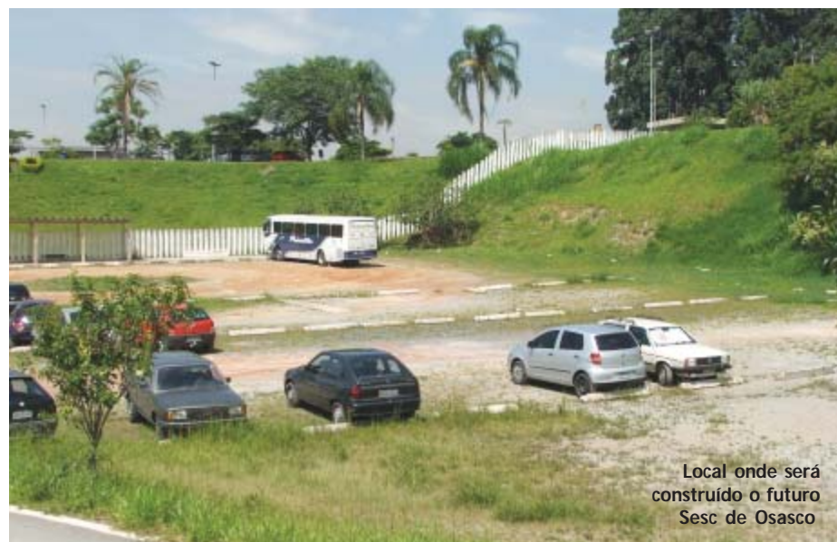
Local onde será construído o futuro Sesc de Osasco